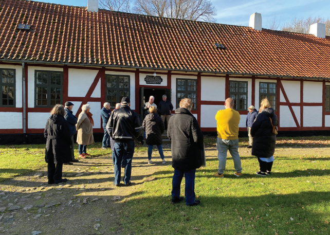
Fremvisning af præstegården